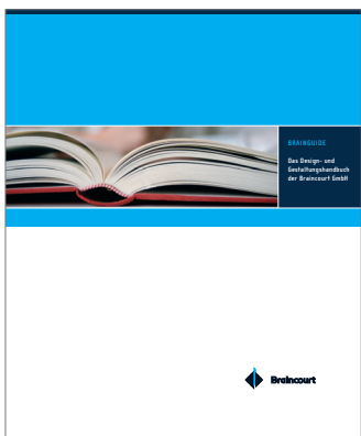
Corporate Design Styleguide